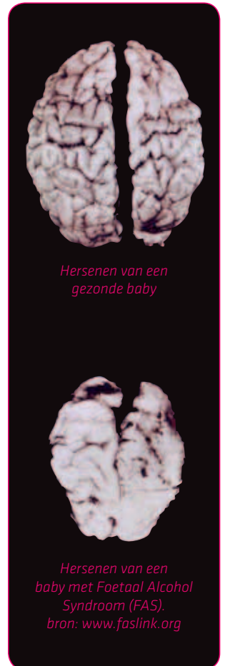
Hersenen van een gezonde baby

Tijdens de zwangerschap worden cellen aangemaakt waarmee lichaamsdelen, hersenen en andere organen groeien. Wanneer je alcohol drinkt tijdens de zwangerschap, kun je de aanmaak van die cellen verstoren. Hierdoor is het mogelijk dat sommige delen van het lichaam van je kindje niet goed groeien. Of je beschadigt organen bij je baby die al ontwikkeld zijn. Vooral de hersenen zijn kwetsbaar: die blijven de gehele zwangerschap in ontwikkeling. Daarom kan alcoholgebruik tijdens ieder moment van de zwangerschap voor hersenschade zorgen. Bij een kind kun je dan afwijkingen zien, zoals een lager IQ, leerproblemen, hyperactiviteit of gedragsproblemen.