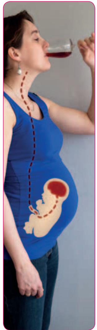
Als je alcohol drinkt, drinkt je baby mee.